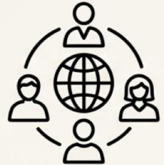
社会への貢献 (Contribution to Society)