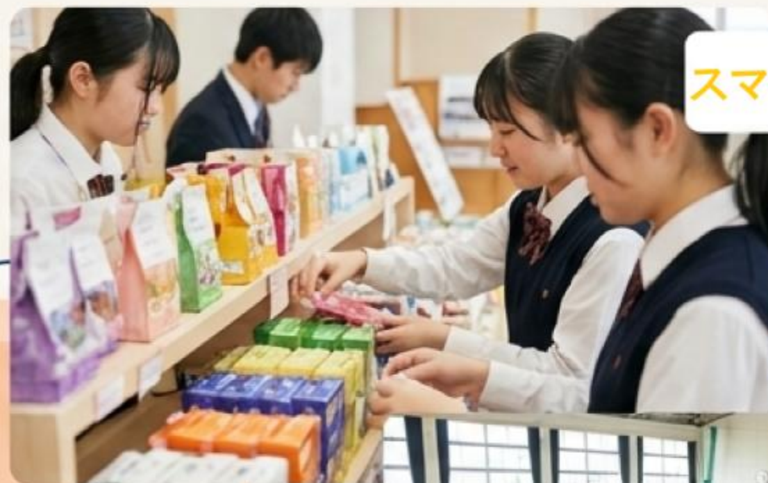
スマイル小商店街