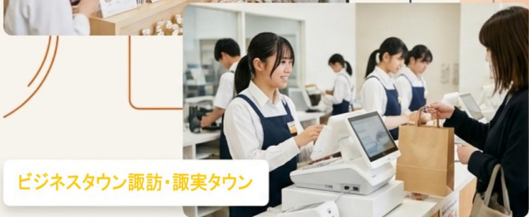
ビジネスタウン諏訪・諏実タウン