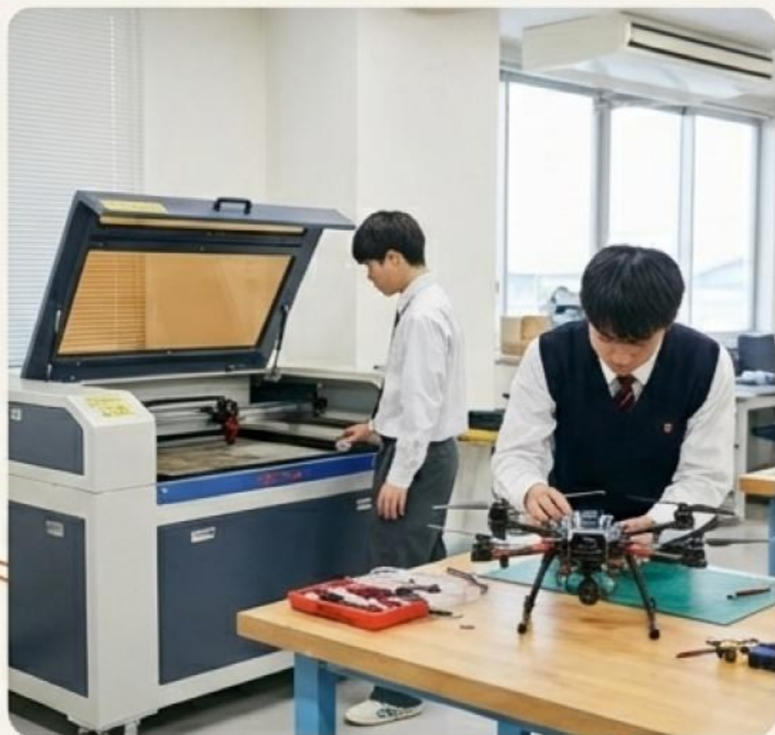
ドローンプログラミング